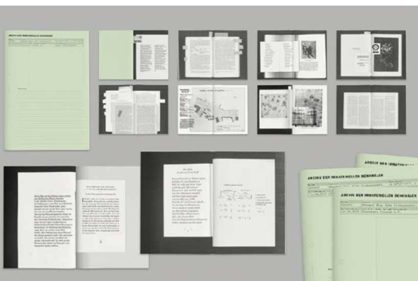
Hagen Verleger in co-operation with Chili Seitz, Archive of the Immaterial Monuments, part of the ongoing series “Künstlerhefte”, Raum für Publikation, Kiel

portfolio.chiliseitz.de hagenverleger.com