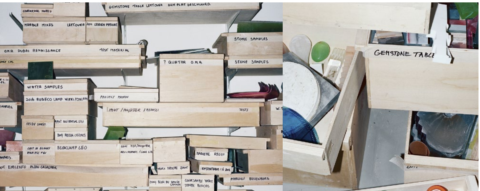
Archive of the Vincent de Rijk workshop, material, colour, and form studies for various projects, documented for the exhibition “Speculative Design Archive” at Het Nieuwe Instituut, Rotterdam (19 Oct 2018 – 10 Mar 2019), art direction: Studio Veronica Ditting

Um Sachverhalte zunächst nachvollziehen und anschließend interpretieren zu können, werden verfügbare und verlässliche Quellen benötigt. Je mehr Aspekte, Tatbestände und Dokumente zugänglich sind, desto genauer lässt sich vor allem Verborgenes rekonstruieren, ein Phänomen, dass Archivare und Archivnutzer mit Kriminalisten oder investigativen Journalisten eint.