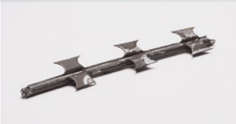
Collection Tobias Stuntebeck, For Industrial Design, NATO-Draht/razor wire